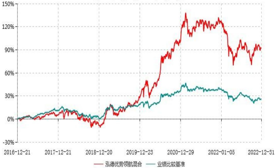
泓德优势领航灵活配置混合型证券投资基金累计净值增长率与业绩比较基准收益率历史走势对比图 (2016年12月21日-2022年12月31日)

注：根据基金合同的约定，本基金建仓期为6个月，截至报告期末，本基金的各项投资比例符合基金合同关于投资范围及投资限制规定。