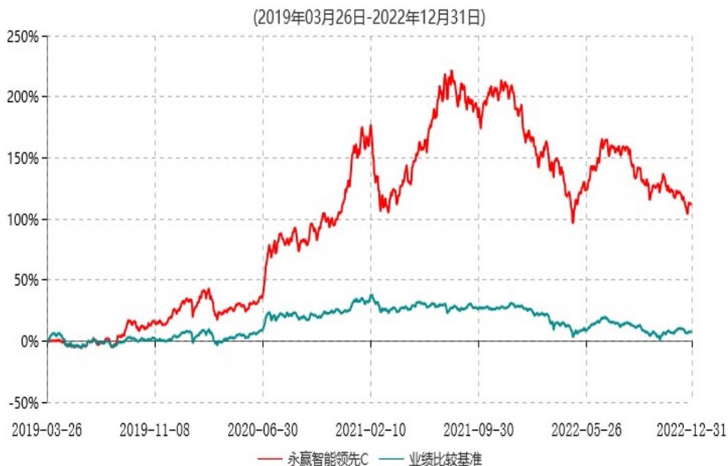
永赢智能领先C累计净值增长率与业绩比较基准收益率历史走势对比图