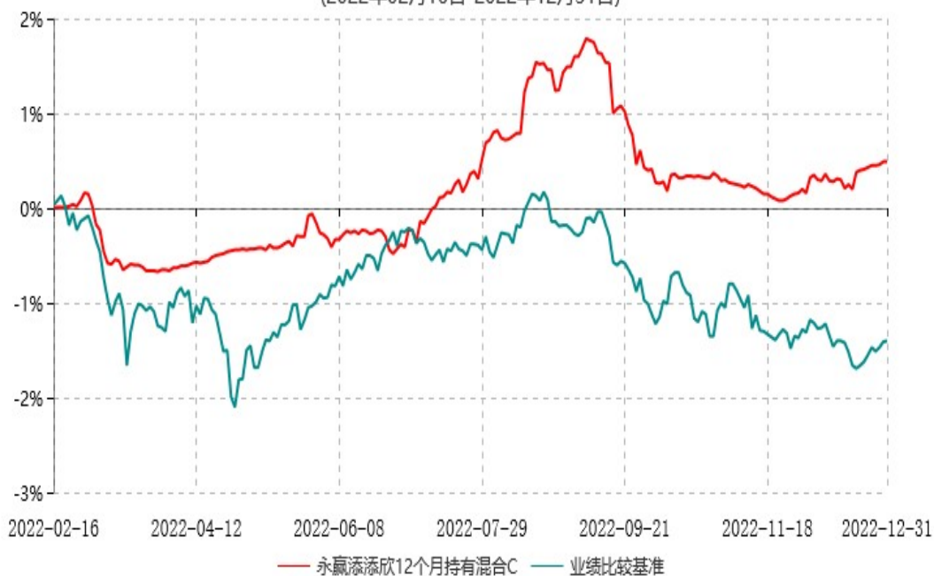
永赢添添欣12个月持有混合C累计净值增长率与业绩比较基准收益率历史走势对比图 (2022年02月16日-2022年12月31日)