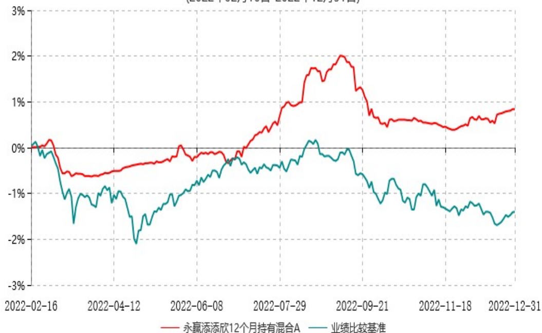
永赢添添欣12个月持有混合A累计净值增长率与业绩比较基准收益率历史走势对比图 (2022年02月16日-2022年12月31日)