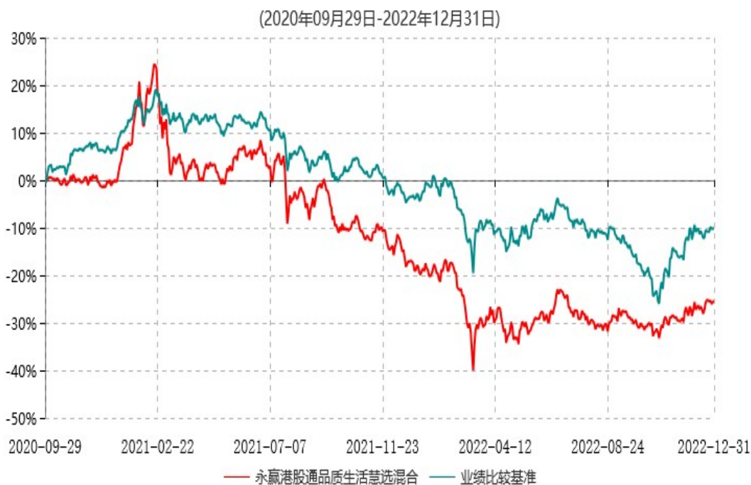
永赢港股通品质生活慧选混合型证券投资基金累计净值增长率与业绩比较基准收益率历史走势对比图