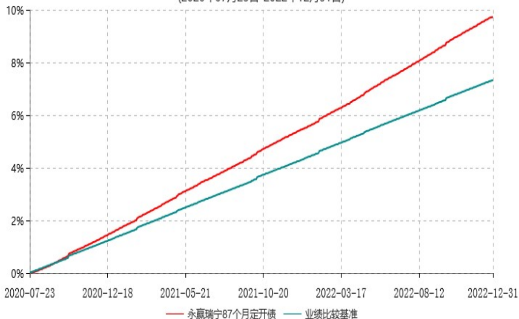
永赢瑞宁87个月定期开放债券型证券投资基金累计净值增长率与业绩比较基准收益率历史走势对比图 (2020年07月23日-2022年12月31日)