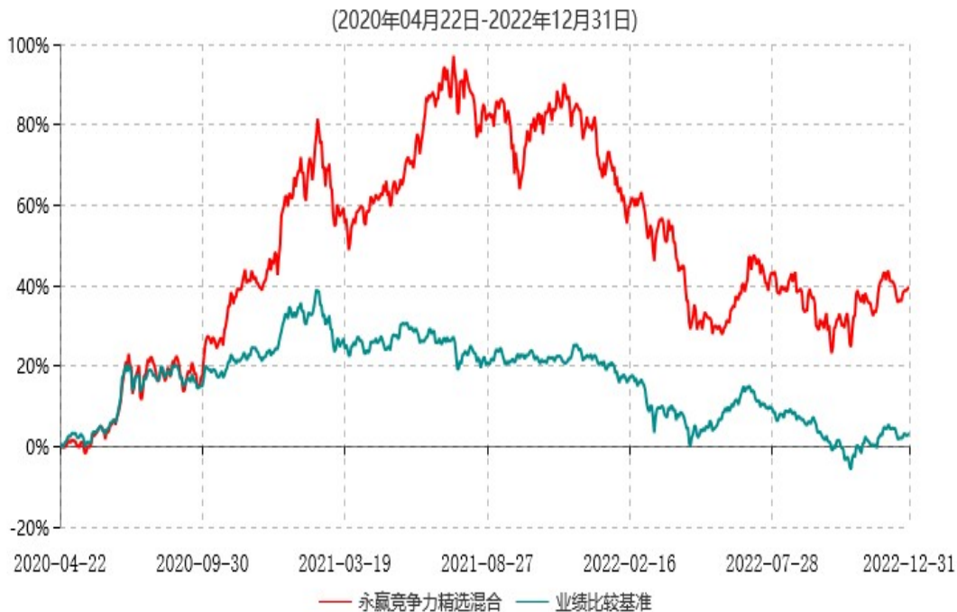
永赢竞争力精选混合型发起式证券投资基金累计净值增长率与业绩比较基准收益率历史走势对比图