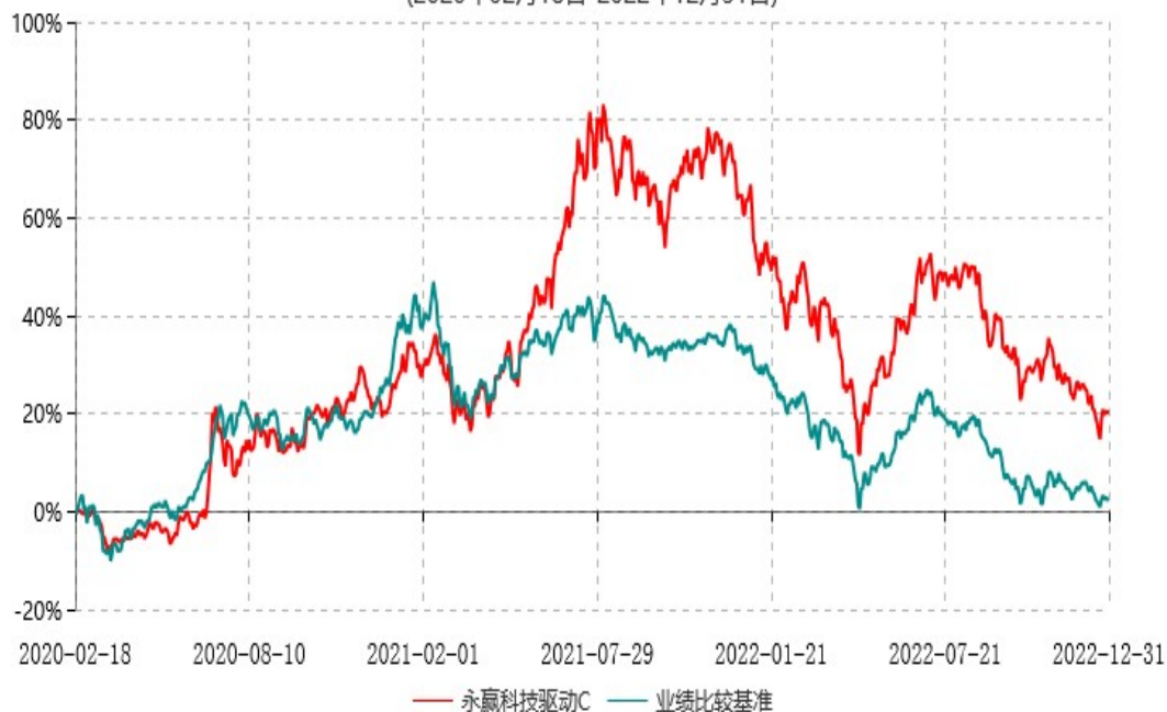
永赢科技驱动C累计净值增长率与业绩比较基准收益率历史走势对比图 (2020年02月18日-2022年12月31日)