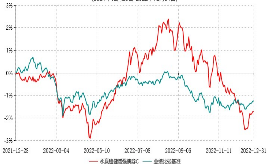
永赢稳健增强债券C累计净值增长率与业绩比较基准收益率历史走势对比图 (2021年12月28日-2022年12月31日)