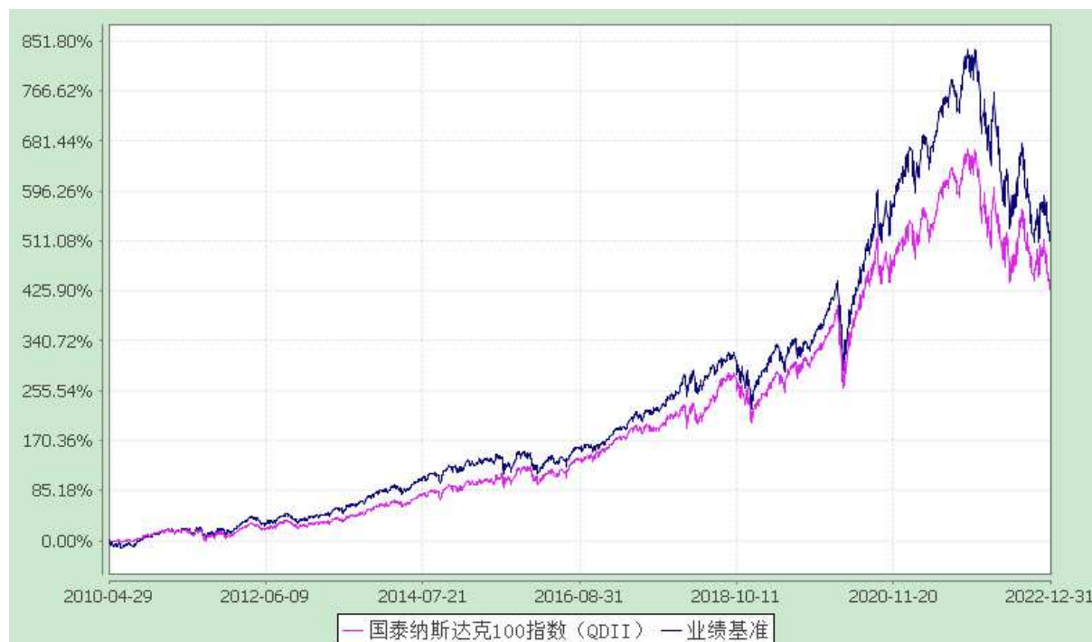
国泰纳斯达克 100 指数证券投资基金 份额累计净值增长率与业绩比较基准收益率历史走势对比图 (2010 年 4 月 29 日至 2022 年 12 月 31 日)

注：（1）本基金合同生效日为 2010 年 4 月 29 日。本基金在六个月建仓期结束时，各项资产配置比例符合合同约定。