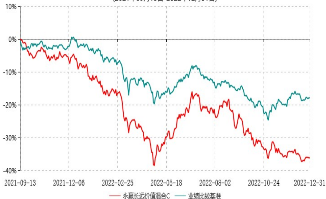
永赢长远价值混合C累计净值增长率与业绩比较基准收益率历史走势对比图 (2021年09月13日-2022年12月31日)