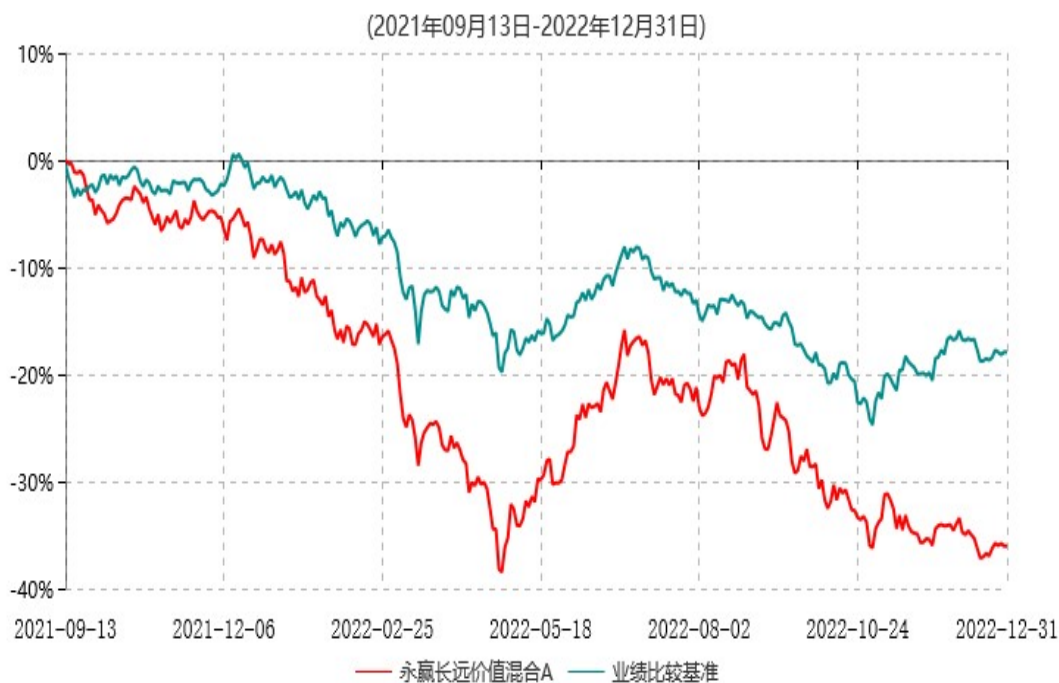
永赢长远价值混合A累计净值增长率与业绩比较基准收益率历史走势对比图