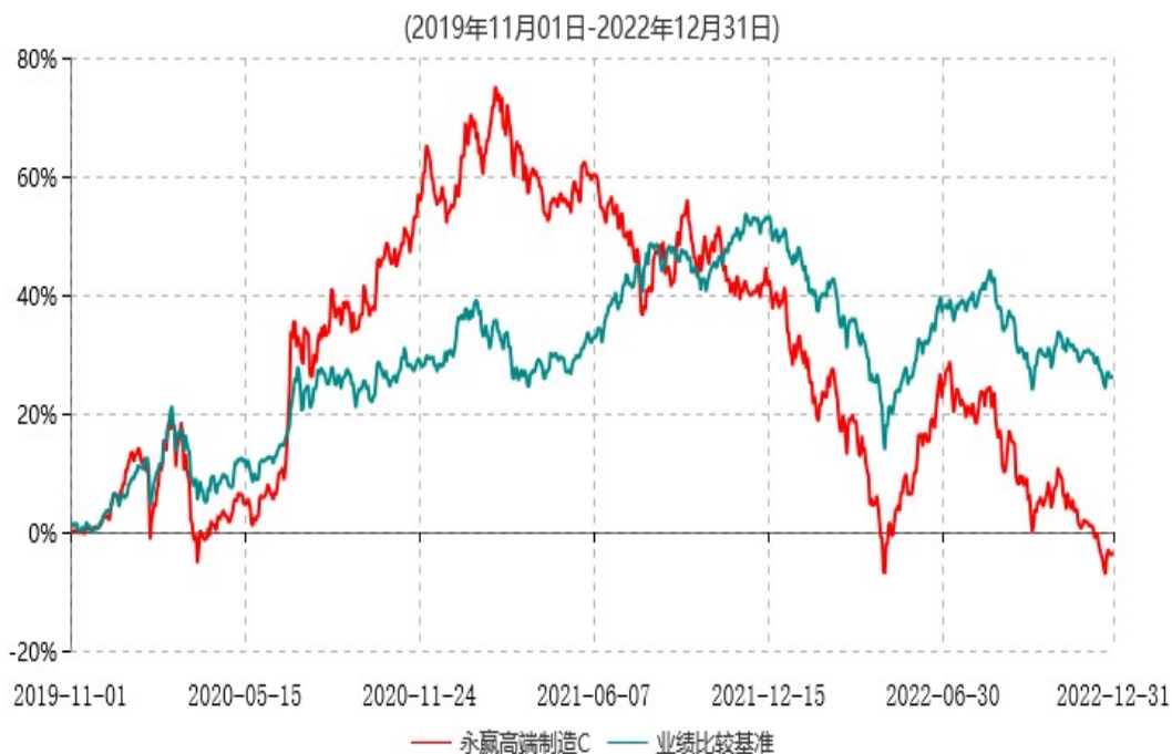
永赢高端制造C累计净值增长率与业绩比较基准收益率历史走势对比图