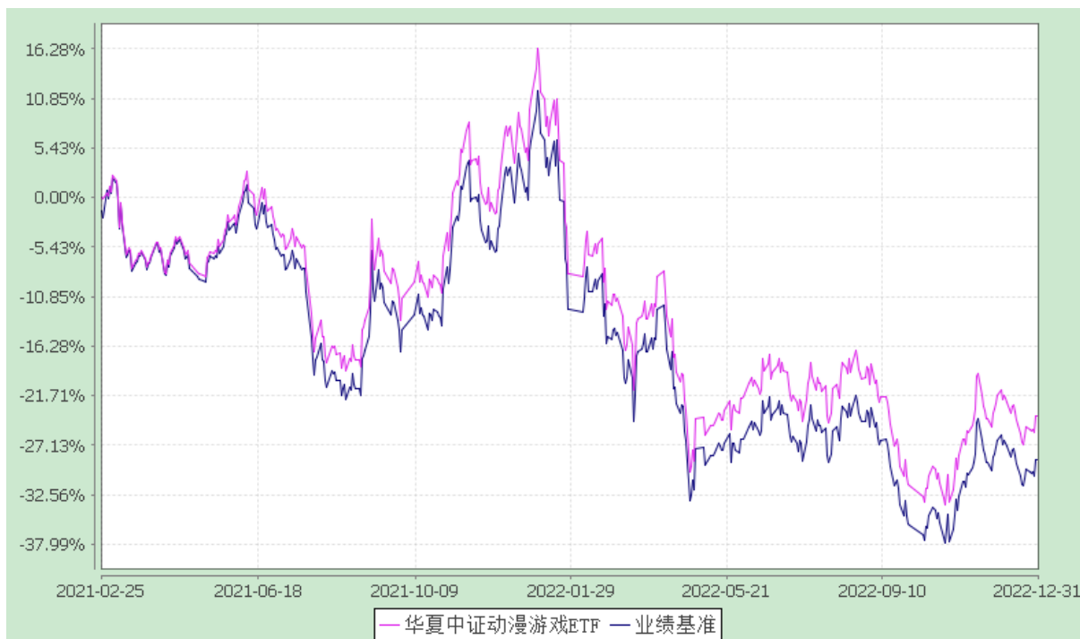
华夏中证动漫游戏交易型开放式指数证券投资基金 份额累计净值增长率与业绩比较基准收益率历史走势对比图 (2021年2月25日至2022年12月31日)