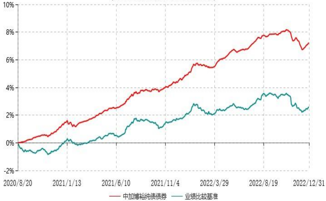
中加博裕纯债债券型证券投资基金累计净值增长率与业绩比较基准收益率历史走势对比图 (2020年08月20日-2022年12月31日)