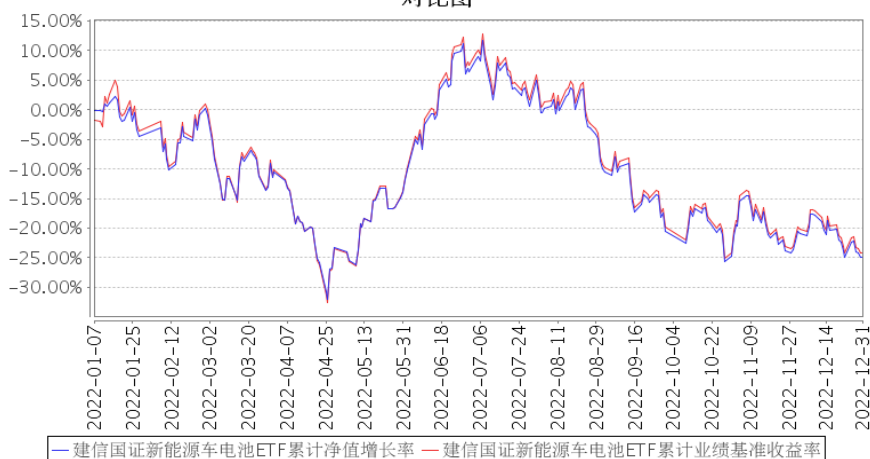
建信国证新能源车电池ETF累计净值增长率与同期业绩比较基准收益率的历史走势对比图