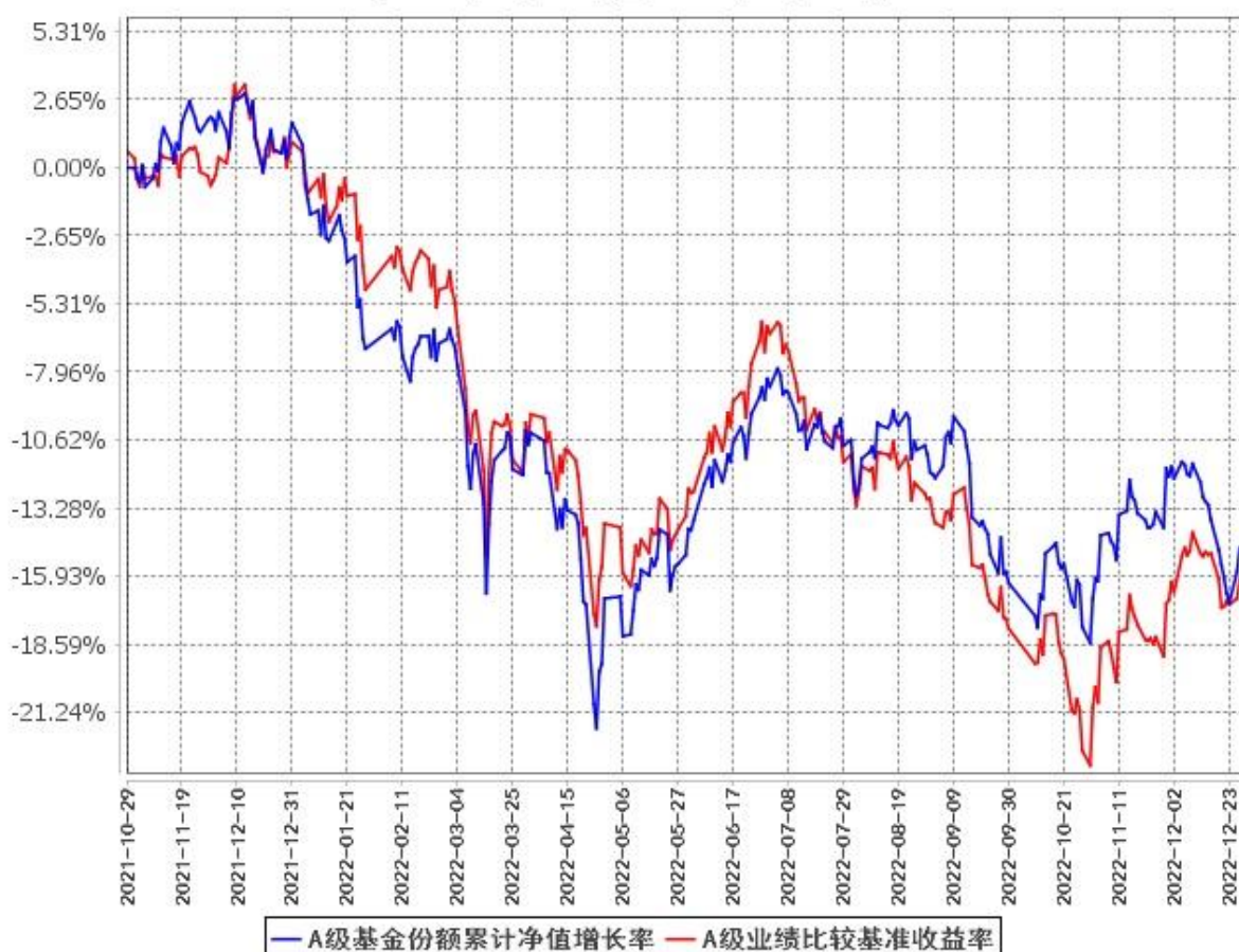
A级基金份额累计净值增长率与同期业绩比较基准收益率的历史走势对比图 (2021年10月29日至2022年12月31日)