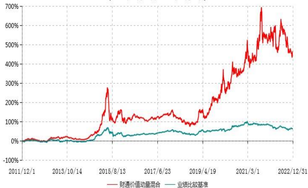
财通价值动量混合型证券投资基金累计净值增长率与业绩比较基准收益率历史走势对比图 (2011年12月01日-2022年12月31日)

注：(1)本基金合同生效日为2011年12月1日； (2)本基金建仓期是合同生效日起6个月，截至报告期末和基金建仓期末，基金的资产配置符合基金契约的相关要求。