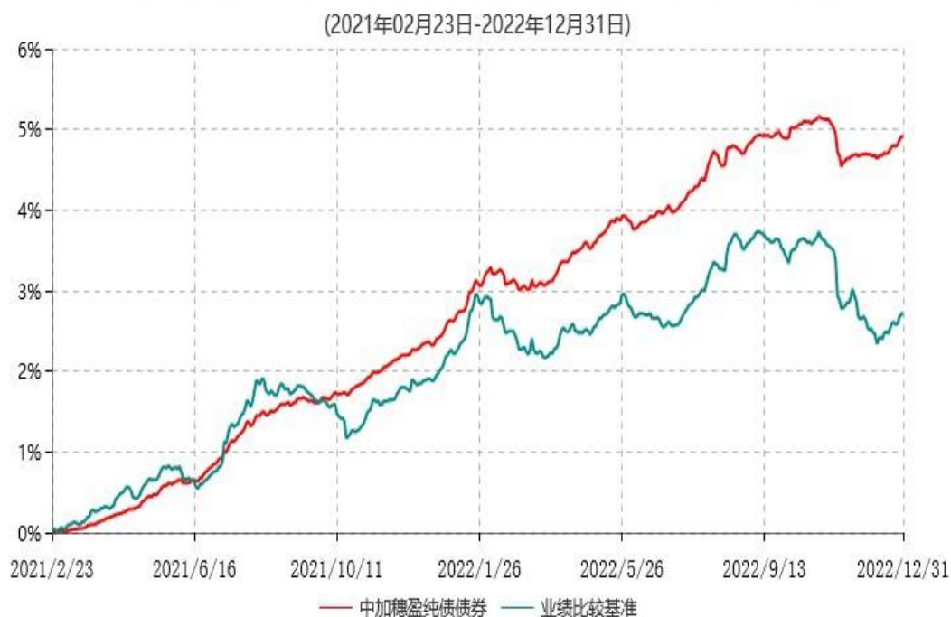
中加穗盈纯债债券型证券投资基金累计净值增长率与业绩比较基准收益率历史走势对比图

注：1.本基金的基金合同于2021年2月23日生效，截至本报告期末，本基金合同生效已满一年。