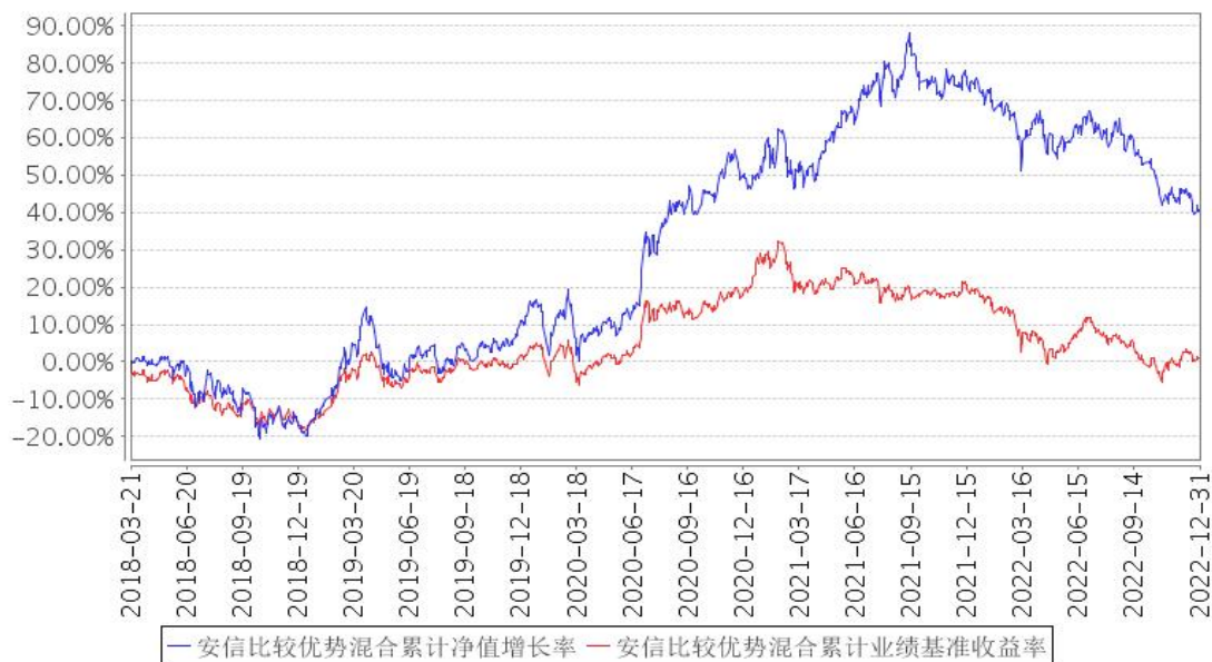
安信比较优势混合累计净值增长率与同期业绩比较基准收益率的历史走势对比图