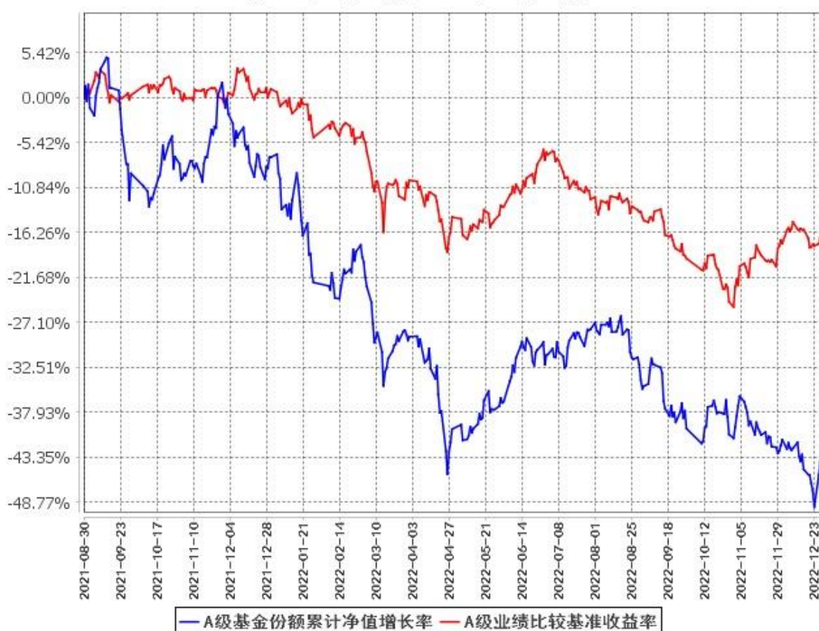
A级基金份额累计净值增长率与同期业绩比较基准收益率的历史走势对比图 (2021年8月30日至2022年12月31日)