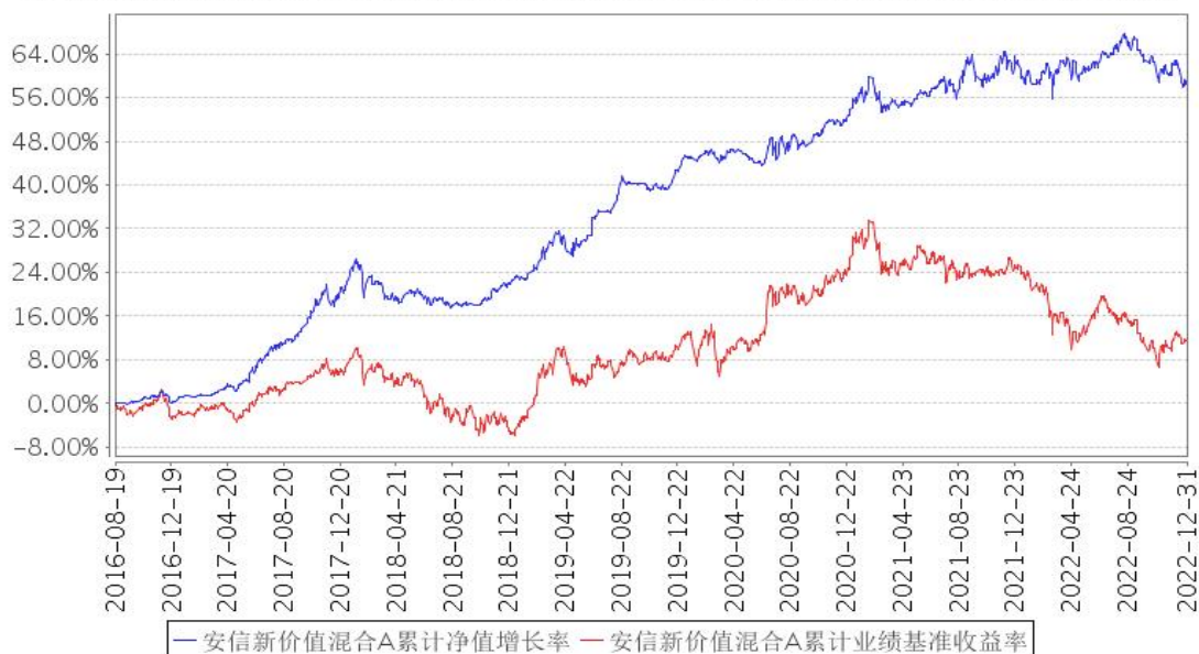
安信新价值混合A累计净值增长率与同期业绩比较基准收益率的历史走势对比图