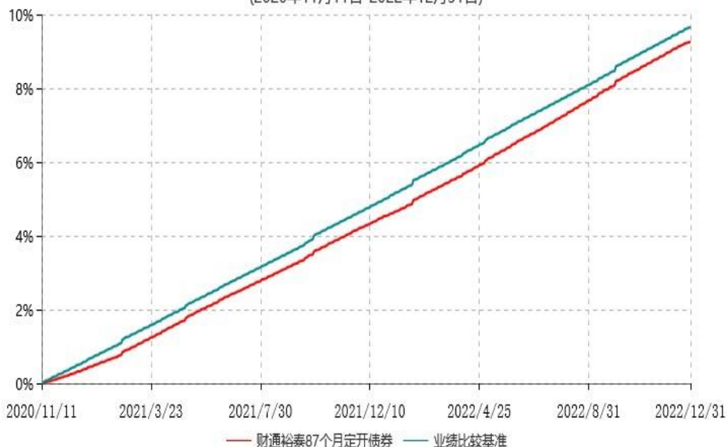
财通裕泰87个月定期开放债券型证券投资基金累计净值增长率与业绩比较基准收益率历史走势对比图 (2020年11月11日-2022年12月31日)