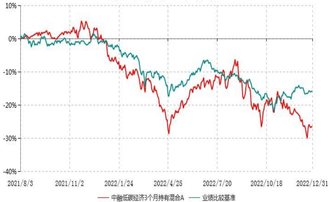
中融低碳经济3个月持有混合A累计净值增长率与业绩比较基准收益率历史走势对比图 (2021年08月03日-2022年12月31日)