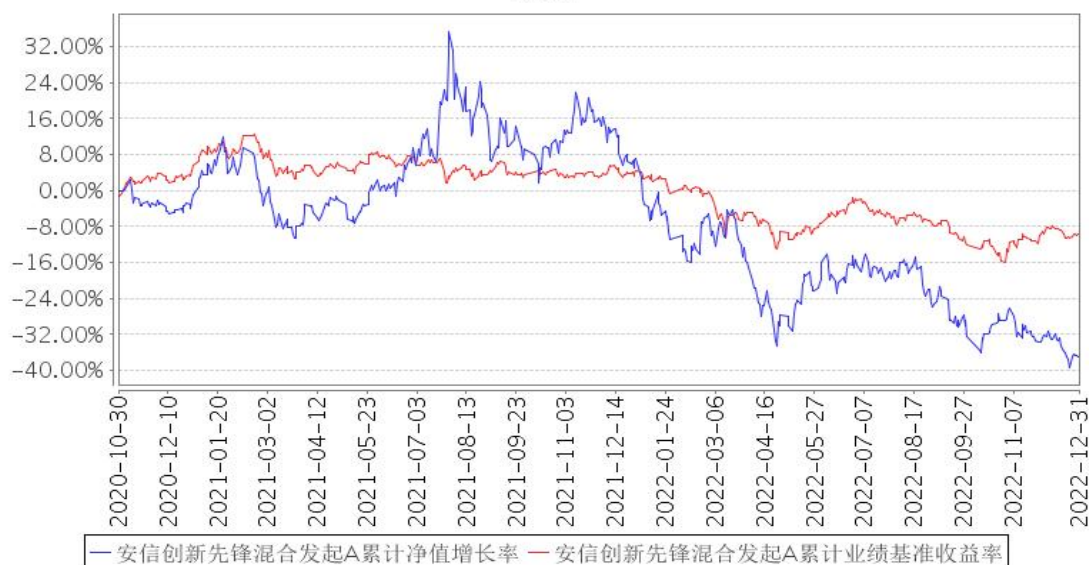
安信创新先锋混合发起A累计净值增长率与同期业绩比较基准收益率的历史走势对比图