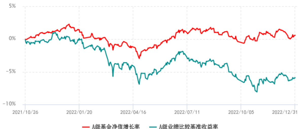
A级基金份额累计净值增长率与同期业绩比较基准收益率历史走势对比图 (2021年10月26日-2022年12月31日)