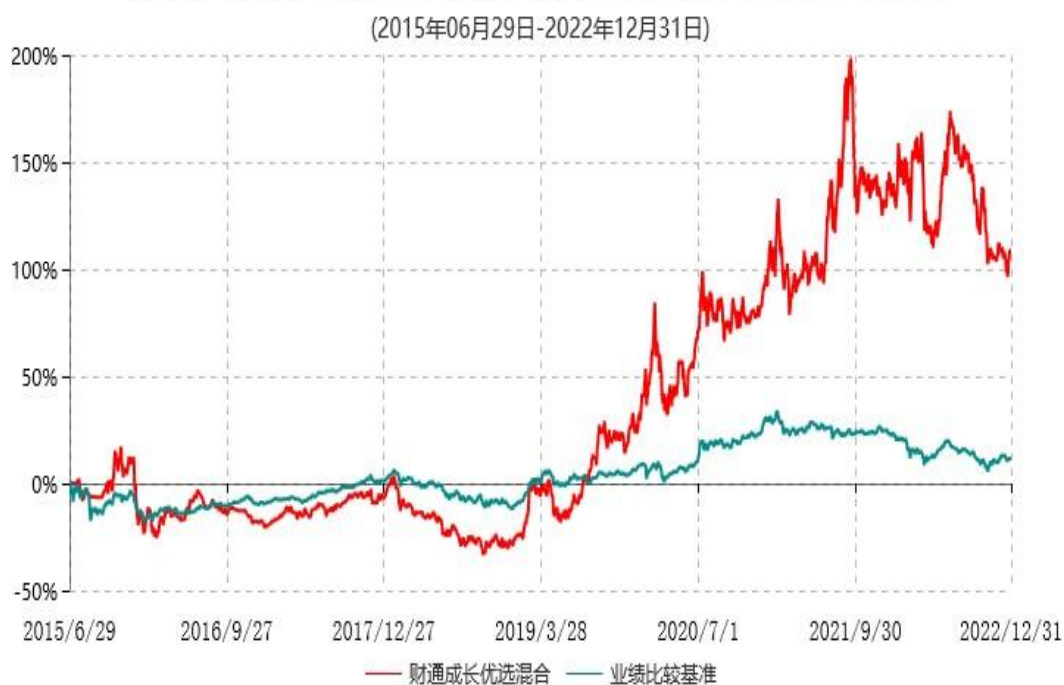
财通成长优选混合型证券投资基金累计净值增长率与业绩比较基准收益率历史走势对比图