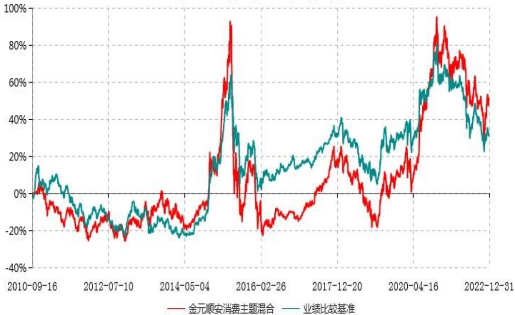
金元顺安消费主题混合型证券投资基金累计净值增长率与业绩比较基准收益率历史走势对比图 (2010年09月15日-2022年12月31日)