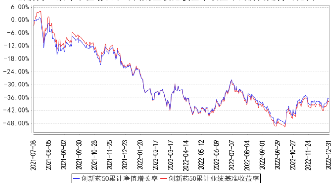
创新药50累计净值增长率与同期业绩比较基准收益率的历史走势对比图