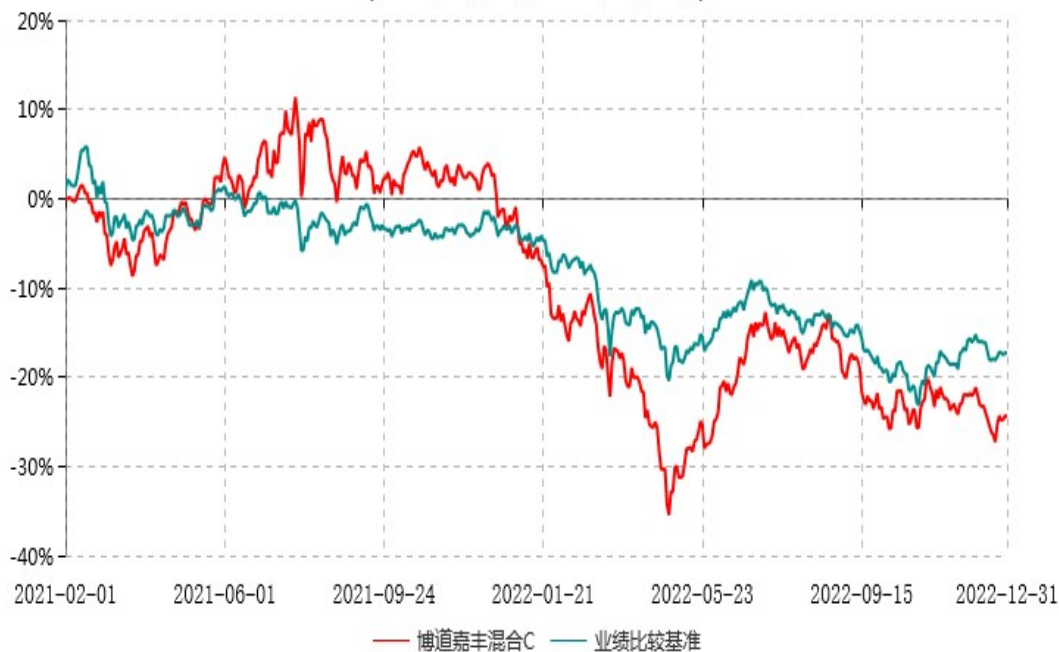
博道嘉丰混合C累计净值增长率与业绩比较基准收益率历史走势对比图 (2021年02月01日-2022年12月31日)

注：本基金建仓期为自基金合同生效日起的6个月。截至建仓期结束，本基金各项资产配置比例符合基金合同及招募说明书有关投资比例的约定。