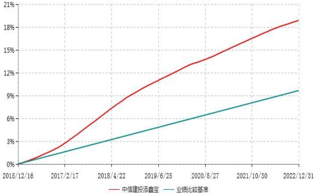
中信建投添鑫宝货币市场基金累计净值收益率与业绩比较基准收益率历史走势对比图 (2015年12月16日-2022年12月31日)