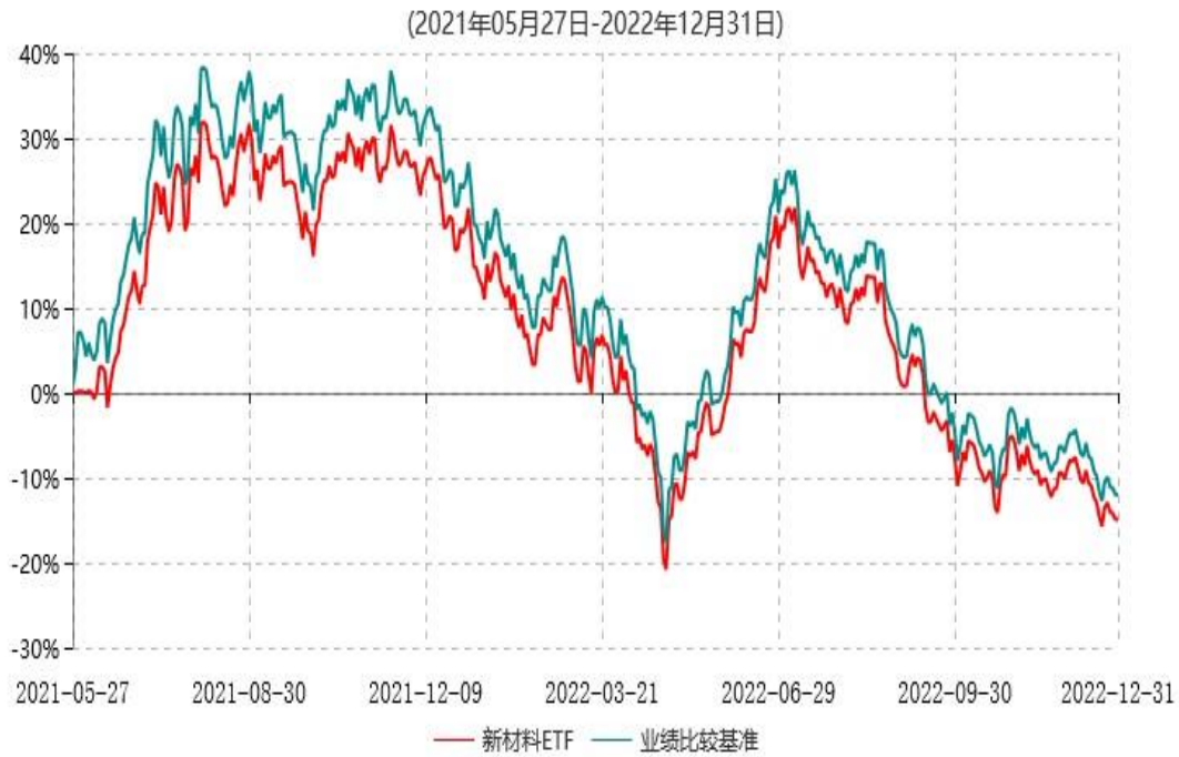
天弘中证新材料主题交易型开放式指数证券投资基金累计净值增长率与业绩比较基准收益率历史走势对比图