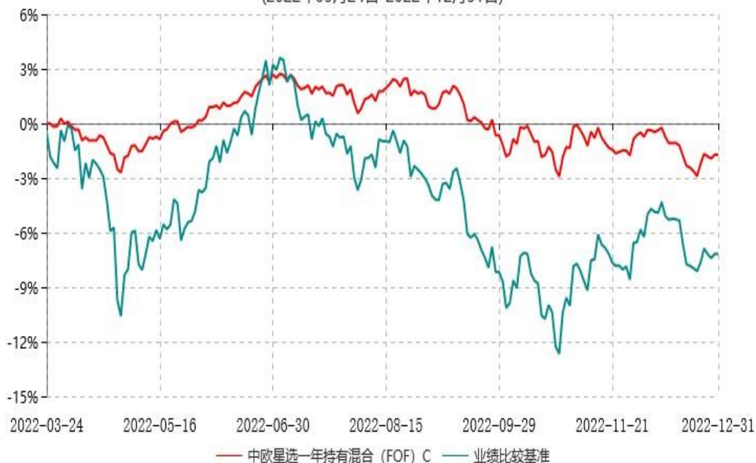
中欧星选一年持有混合（FOF）C累计净值增长率与业绩比较基准收益率历史走势对比图 (2022年03月24日-2022年12月31日)

注：本基金基金合同生效日期为2022年3月24日，自基金合同生效日起到本报告期末不满一年，按基金合同的规定，本基金自基金合同生效起六个月为建仓期，建仓期结束时各项资产配置比例已符合基金合同约定。