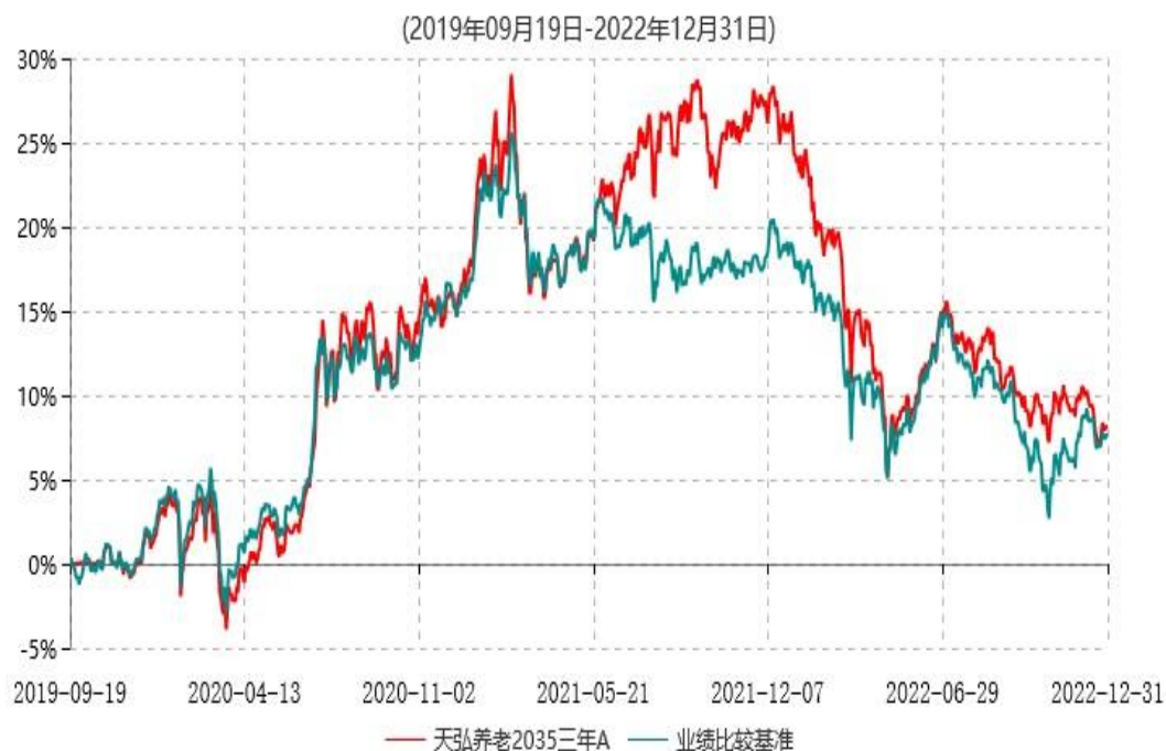
天弘养老2035三年A累计净值增长率与业绩比较基准收益率历史走势对比图