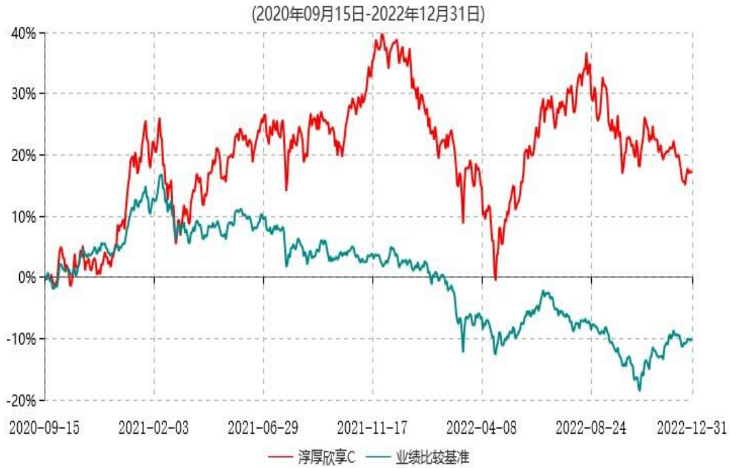
淳厚欣享C累计净值增长率与业绩比较基准收益率历史走势对比图

注：本基金基金合同生效日为2020年9月15日。按基金合同规定，本基金自基金合同生效起6个月内为建仓期。建仓期结束时本基金的各项投资比例均符合基金合同约定。