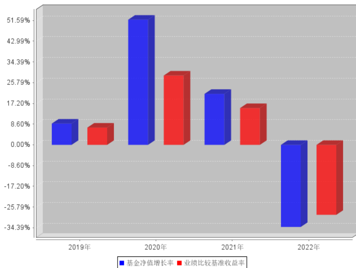
自基金合同生效以来基金每年净值增长率及其与同期业绩比较基准收益率的对比图

注：本基金合同生效日为 2019 年 9 月 17 日，合同生效当年按实际存续期计算，不按整个自然年度进行折算。