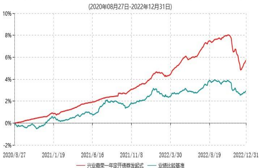
兴业嘉荣一年定期开放债券型发起式证券投资基金累计净值增长率与业绩比较基准收益率历史走势对比图

注：根据本基金基金合同规定，基金管理人自基金合同生效之日起6个月内已使基金的投资组合比例符合基金合同的有关规定。