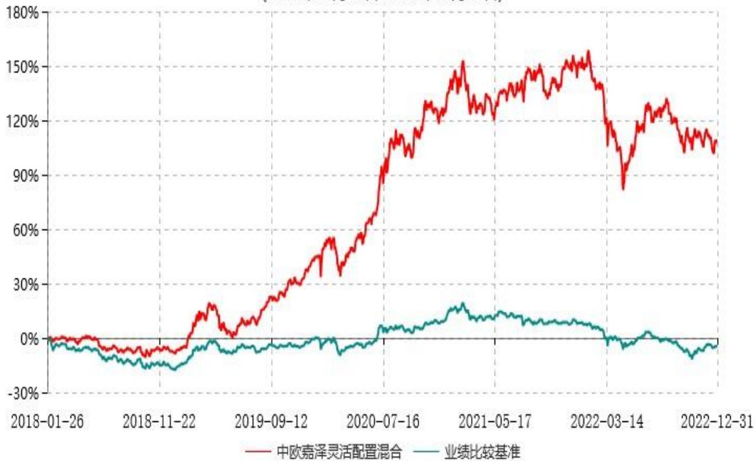
中欧嘉泽灵活配置混合型证券投资基金累计净值增长率与业绩比较基准收益率历史走势对比图 (2018年01月26日-2022年12月31日)