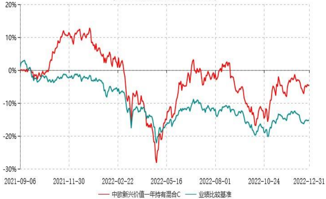
中欧新兴价值一年持有混合C累计净值增长率与业绩比较基准收益率历史走势对比图 (2021年09月06日-2022年12月31日)

注：本基金基金合同生效日期为2021年9月6日，按基金合同的规定，本基金自基金合同生效起六个月为建仓期，建仓期结束时各项资产配置比例已符合基金合同约定。