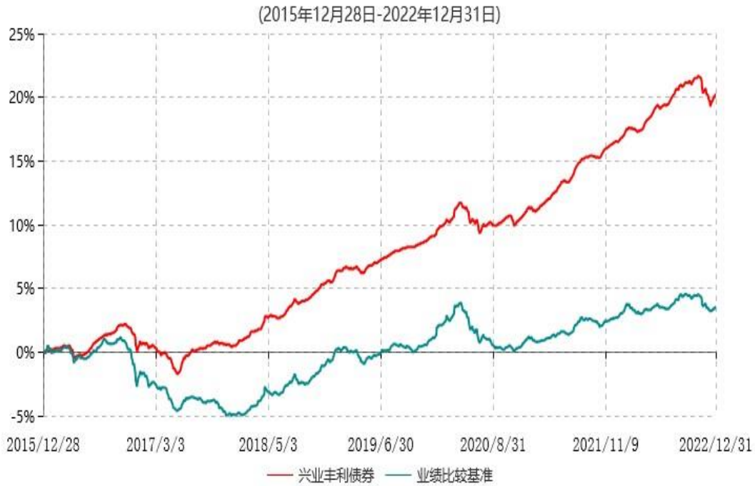
兴业丰利债券型证券投资基金累计净值增长率与业绩比较基准收益率历史走势对比图