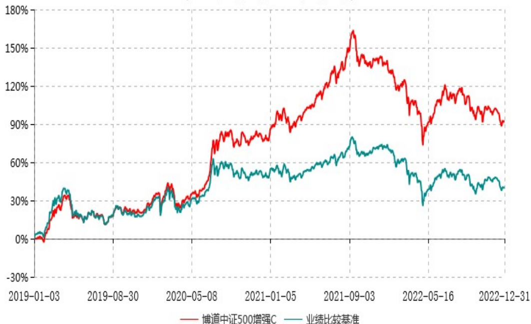
博道中证500增强C累计净值增长率与业绩比较基准收益率历史走势对比图 (2019年01月03日-2022年12月31日)

注：本基金建仓期为自基金合同生效日起的6个月。截至建仓期结束，本基金各项资产配置比例符合基金合同及招募说明书有关投资比例的约定。