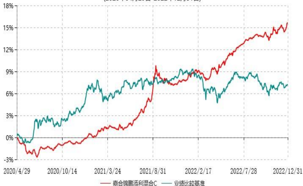
嘉合锦鹏添利混合C累计净值增长率与业绩比较基准收益率历史走势对比图 (2020年04月29日-2022年12月31日)