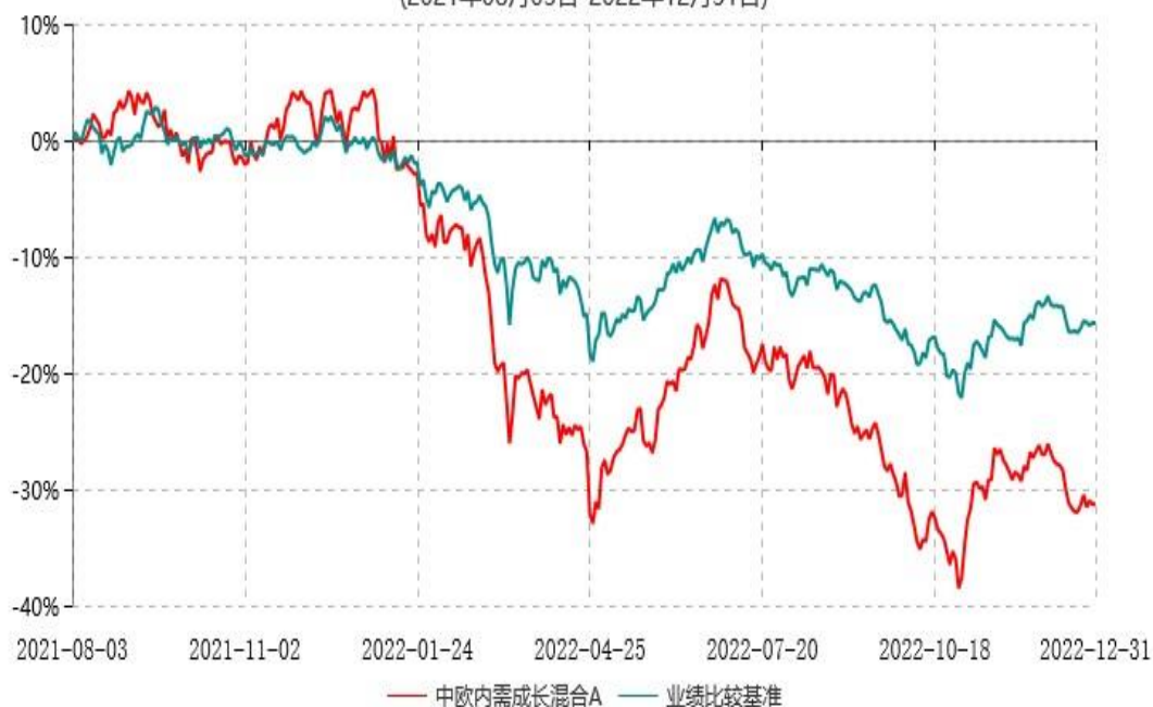
中欧内需成长混合A累计净值增长率与业绩比较基准收益率历史走势对比图 (2021年08月03日-2022年12月31日)

注：本基金基金合同生效日期为2021年8月3日，按基金合同的规定，本基金自基金合同生效起六个月为建仓期，建仓期结束时各项资产配置比例已符合基金合同约定。