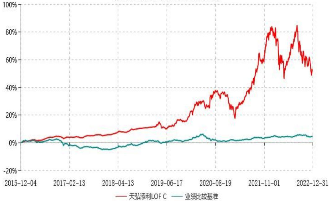
天弘添利LOF E累计净值增长率与业绩比较基准收益率历史走势对比图