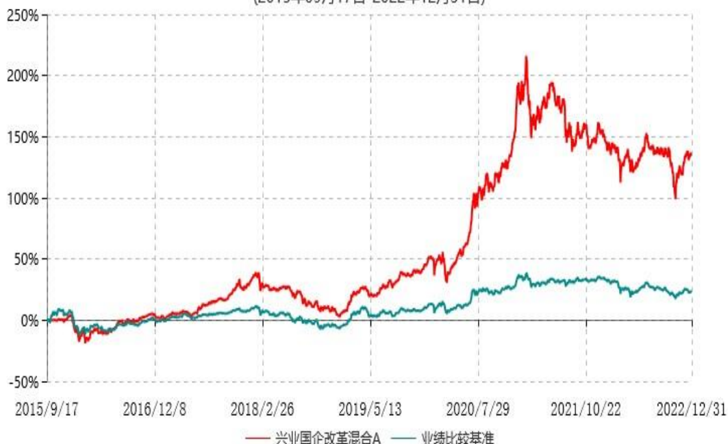
兴业国企改革混合A累计净值增长率与业绩比较基准收益率历史走势对比图 (2015年09月17日-2022年12月31日)

注：本基金基金合同于2015年9月17日生效，根据本基金基金合同规定，本基金自基金合同生效之日起六个月内已使基金的投资组合比例符合基金合同的约定。