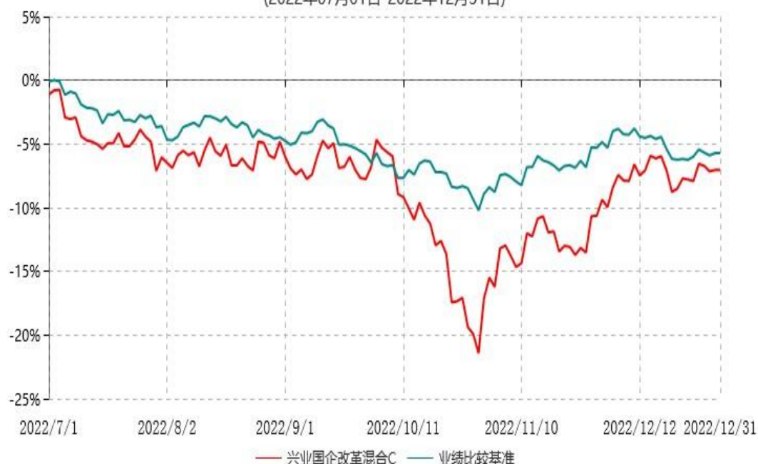
兴业国企改革混合C累计净值增长率与业绩比较基准收益率历史走势对比图 (2022年07月01日-2022年12月31日)

注：本基金基金合同于2015年9月17日生效，根据本基金基金合同规定，本基金自基金合同生效之日起六个月内已使基金的投资组合比例符合基金合同的约定。