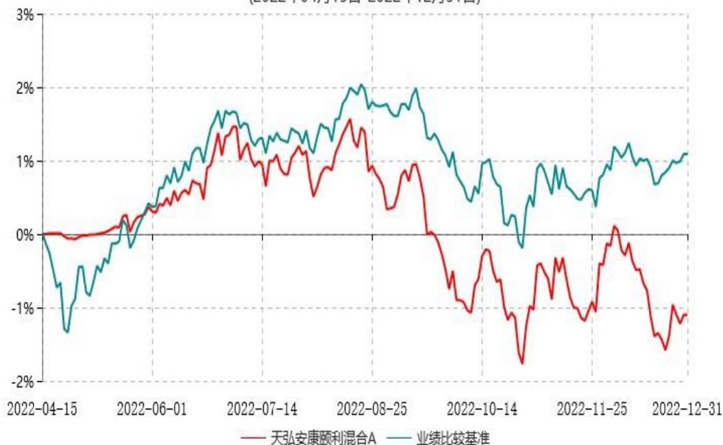
天弘安康颐利混合C累计净值增长率与业绩比较基准收益率历史走势对比图