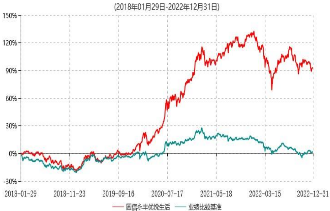
圆信永丰优悦生活混合型证券投资基金累计净值增长率与业绩比较基准收益率历史走势对比图