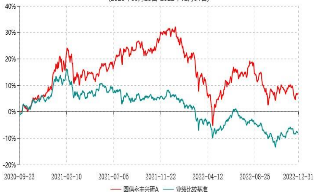
圆信永丰兴研C累计净值增长率与业绩比较基准收益率历史走势对比图