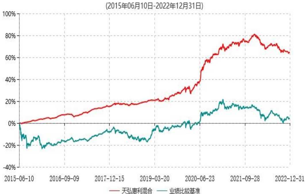
天弘惠利灵活配置混合型证券投资基金累计净值增长率与业绩比较基准收益率历史走势对比图