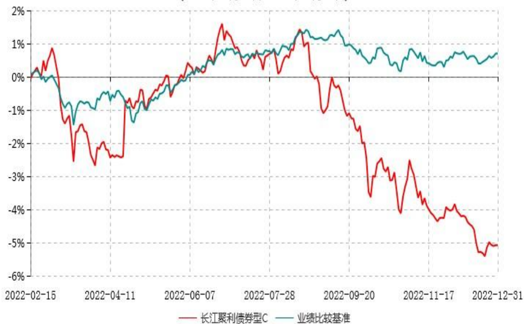
长江聚利债券型C累计净值增长率与业绩比较基准收益率历史走势对比图 (2022年02月15日-2022年12月31日)

注：（1）本基金A类份额“自基金合同生效以来”的报告期为2022年1月11日至2022年12月31日，截至本报告期末未满一年；（2）本基金建仓期为基金合同生效日起6个月内，建仓期结束时各项资产配置比例均符合基金合同约定。