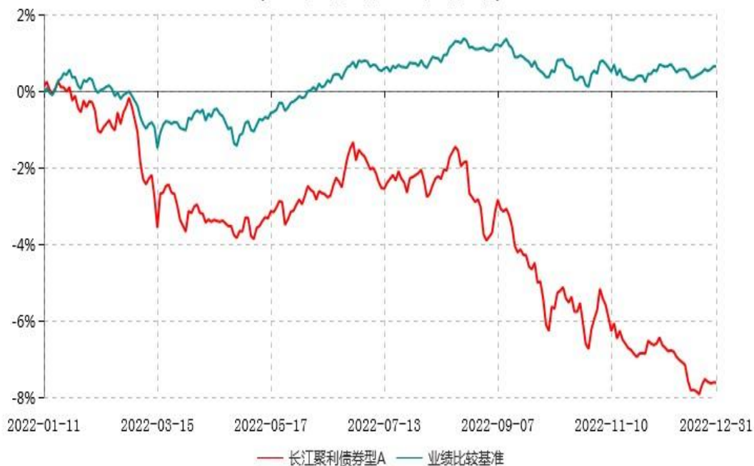
长江聚利债券型A累计净值增长率与业绩比较基准收益率历史走势对比图 (2022年01月11日-2022年12月31日)

注：（1）本基金A类份额“自基金合同生效以来”的报告期为2022年1月11日至2022年12月31日，截至本报告期末未满一年；（2）本基金建仓期为基金合同生效日起6个月内，建仓期结束时各项资产配置比例均符合基金合同约定。