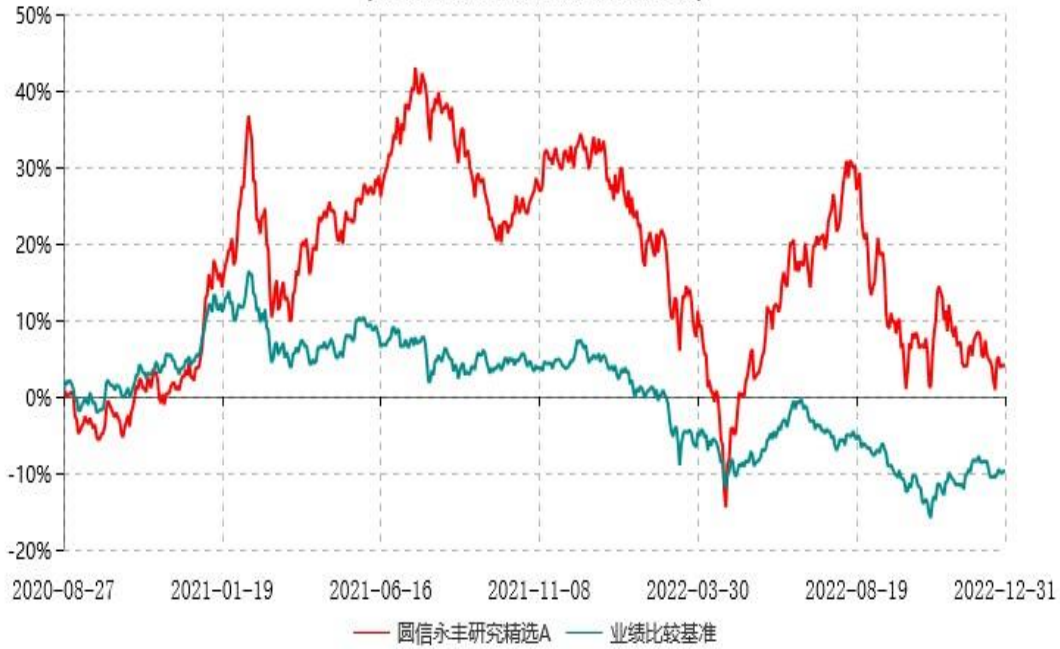
圆信永丰研究精选C累计净值增长率与业绩比较基准收益率历史走势对比图