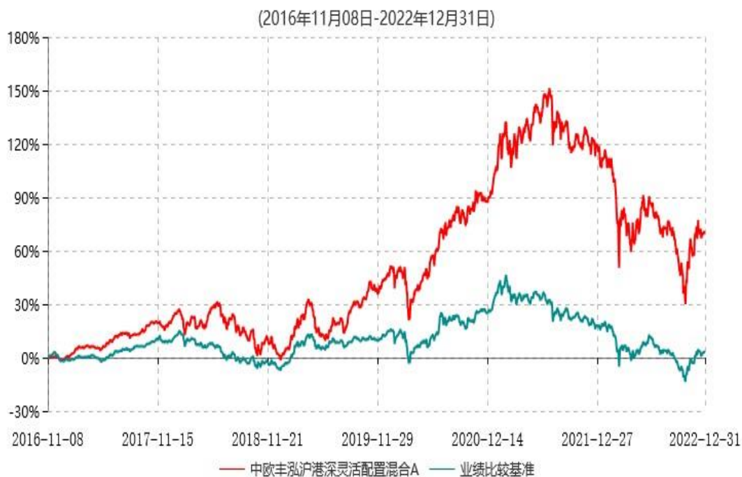
中欧丰泓沪港深灵活配置混合A累计净值增长率与业绩比较基准收益率历史走势对比图

注：2020年2月22日起组合业绩比较基准由“沪深300指数收益率×60%+中债综合指数收益率×40%”变更为“沪深300指数收益率*35%+中证港股通综合指数收益率*55%+中证短债指数收益率*10%”。